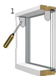
Kiinnitys ikkunan syvennykseen