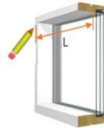
Kiinnitys seinän pintaan/kattoon