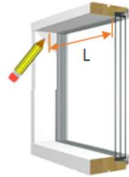
Kiinnitys ikkunan syvennykseen

3. Asenna rullakaihdin kiinnikkeisiin niin, että jousella varustettu akselin pää toiseen kiinnikkeen reikään ja ketjupää toisen kiinnikkeen koloihin. Jousi keskittää verhon kiinnikkeiden väliin, kun ne on asennettu oikealle etäisyydelle toisistaan. Varmista, että ketjun suunta on alaspäin.