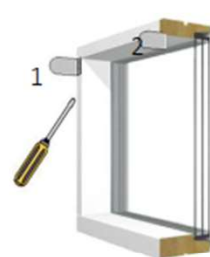
Kiinnitys seinän pintaan/kattoon